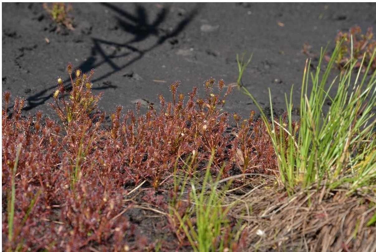
Abb. 13: Massenbestände des Mittleren Sonnentaus ( Drosera intermedia ) mit Weißer Schnabelbinse ( Rhynchospora alba ) im Torfstich des Preisinger Moores