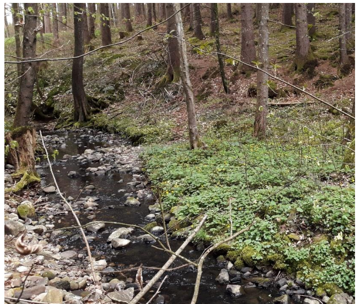
Abb. 27: Schwarzerlen-Eschenauwald entlang des Forstgraben im Frühjahrsaspekt