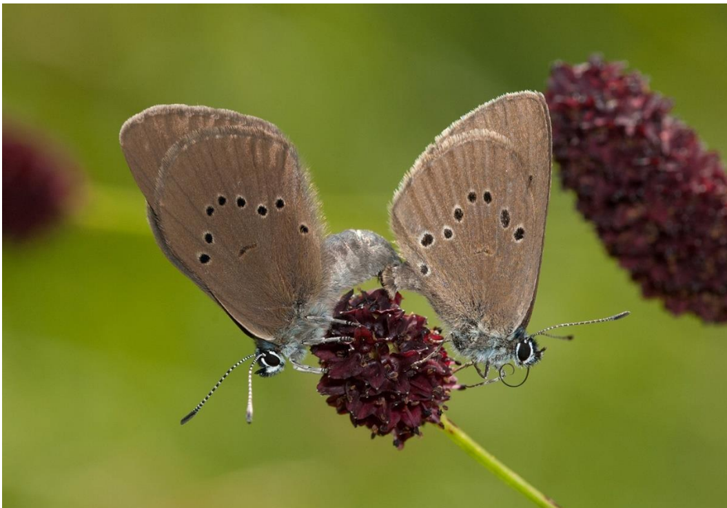
Abb. 33: Dunkler Wiesenknopf-Ameisenbläuling ( Phengaris nausithous )

Eine Sommermahd der Flächen vor September wird nicht vertragen, da sich die Raupen dann noch in den Blüten befinden.