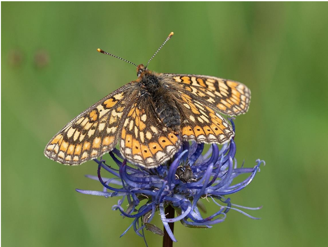
Abb. 34: Skabiosen-Scheckenfalter ( Euphydryas aurinia )

Der Skabiosen-Scheckenfalter erlitt in den letzten 100 Jahren starke Bestandseinbußen und ist seit Mitte der 1990er Jahre aus vielen Gebieten Bayerns verschwunden, wobei die Situation im Alpenvorland noch deutlich günstiger ist.