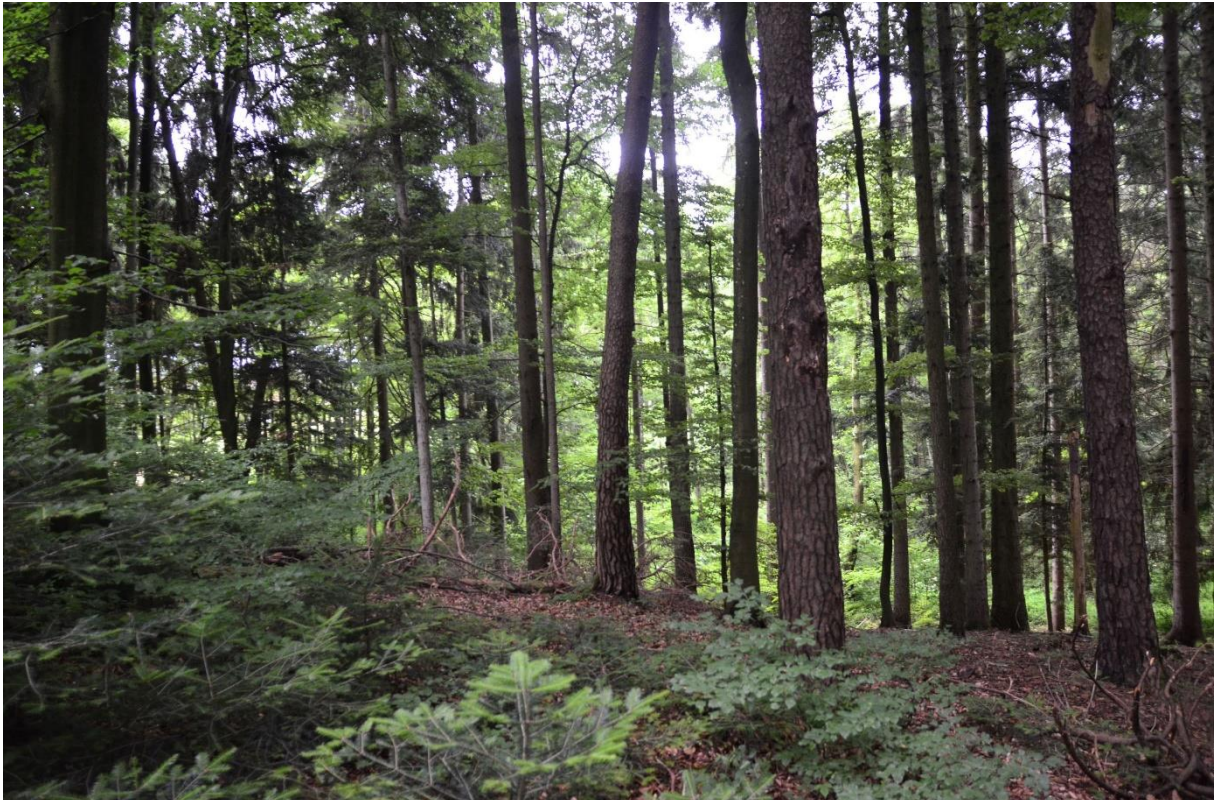
Abb. 25: Waldmeister-Buchenwald mit Tannen-Naturverjüngung westlich von Rückstetten

Es handelt sich hierbei um mitteleuropäische Buchenwälder auf neutralen, kalkhaltigen, basenreichen Böden der planaren bis montanen Höhenstufe. Die Krautschicht ist in der Regel gut ausgebildet und häufig reich an Geophyten. Teilweise ist Weißtanne ( Abies alba ) beigemischt. Da Deutschland im Zentrum des Verbreitungsgebiets der Rotbuche ( Fagus sylvatica ) liegt, kommt der Bundesrepublik eine besondere Verantwortung für diesen Lebensraumtyp zu (KNAPP et al. 2008). In Bayern würde dieser LRT potenziell natürlich mindestens 40 Prozent der momentanen Waldfläche einnehmen (LFU & LWF 2010).