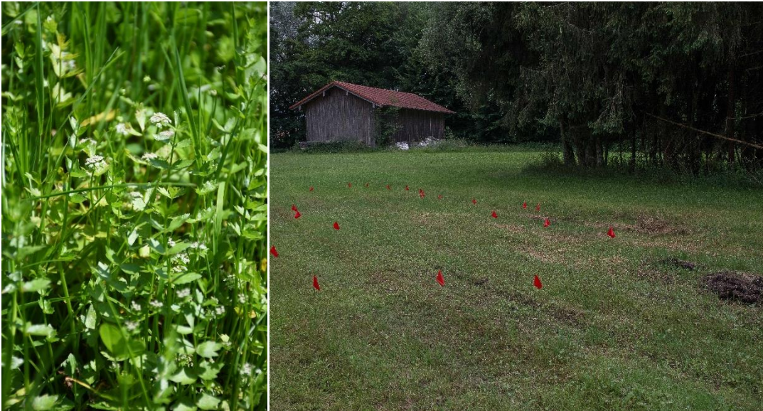
Abb. 43: Links: Blühender Kriechender Sellerie ( Helosciadium [=Apium] repens ) im Feuchtgrünland bei Neuhaus. Rechts: Umgriff des größten, südlichen Teils des Bestands.

Der Kriechende Sellerie ist ein ausdauernder Doldenblütler, der sowohl Land-, als auch Wasserformen ausbildet. An Land bildet die Art niederliegende und kriechende Triebe aus, die an den Knoten bewurzeln. Diese Kriechtriebe sind bis zu 30 cm lang. Im Wasser bildet die Art dagegen bis über 1 m lange Stängel aus.