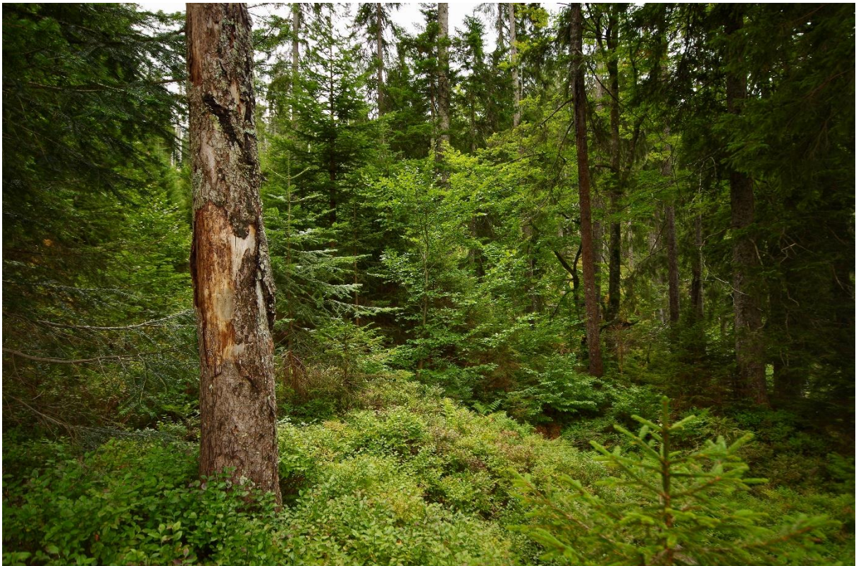
Abb. 31: Lichte Beerstrauchreiche Nadelwälder der Alpen

In diesem Lebensraumtyp werden sieben unterschiedliche Waldgesellschaften unterschieden. In der natürlichen Waldzusammensetzung Bayerns kommen Fichtenwälder in den östlichen Mittelgebirgen, im südlichen Alpenvorland und in den Alpen vor. Die Fichte ( Picea abies ) kann bei Jahresmitteltemperaturen von 3 bis 4°C zur Hauptbaumart werden. Die klimatischen Voraussetzungen für (höhen-) zonale Fichtenwälder sind nur in der tiefsubalpinen Höhenstufe der Bayerischen Alpen (oberhalb von 1.400 bis 1.500 m ü. d. M.) und des Inneren Bayerischen Waldes (oberhalb von 1.100 bis 1.200 m ü. d. M.) erfüllt. Natürliche Fichten- und Fichten-Tannenwälder finden sich aber auch azonale, wie im vorliegenden FFH-Gebiet, in submontaner (und montaner) Lage auf Sonderstandorten wie (kaltluftführenden Blockhalden,) wechselfeuchten oder ganzjährig feuchten Wasserüberschussstandorten. Die Bezeichnung „bodensaure“ bezieht sich nur auf die Tendenz zur Bildung von saurem Auflagehumus (Rohhumus oder Tangel). Das Bodenausgangssubstrat kann sauer, intermediär oder kalkhaltig sein. Im FFH-Gebiet ist ausschließlich die azonale Ausprägung des Subtyps „9412“ Hainsimsen-Fichten-Tannenwald (Luzulo-Abietetum) auf sauren, (wechsel-)feuchten Mineralböden mit Auflagehumus vertreten.