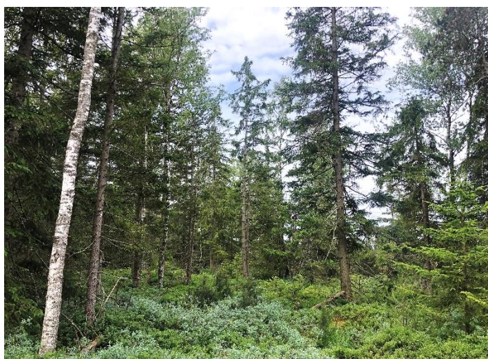
Abb. 15 Mischtyp 91D0* hier mit Fichte und Moorbirke im Hauptbestand, sowie Rausch- und Heidelbeere in der Strauchschicht

Einige Bereiche der Moorwälder im FFH-Gebiet sind geprägt durch einen kleinflächigen Wechsel der Hauptbaumart, so dass dort der Mischtyp 91D0* ausgewiesen wurde. Durch die häufig anthropogen ausgelöste Sukzession (z.B. durch Entwässerung und Torfabbau) entwickelten sich sekundäre, in ihrer Zusammensetzung uneinheitliche Moorwaldbestände, die keinem der naturnahen Subtypen zuzuordnen sind. Häufig dominiert die Fichte. Der Lebensraumtyp kommt im FFH-Gebiet häufig auf durch Entwässerung beeinflussten Standorten vor.