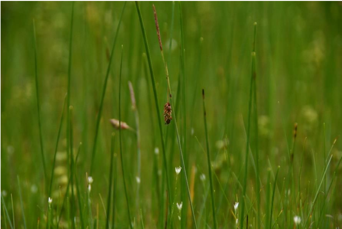
Abb. 9: Schlenkengesellschaft mit Schlamm-Segge ( Carex limosa ) und Weißer Schnabelbinse ( Rhynchospora alba ) im Schönramer Filz

So wurden insgesamt nur 5 Teilflächen dieses Lebensraumtyps erfasst, die knapp 1 ha Fläche ausmachen.