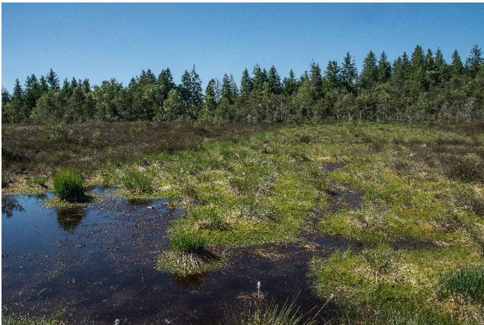
Abb. 10: Hochmoor-Regeneration in einem Torfstich im Preisinger Moos

Die unzähligen Gräben und offensichtlichen Austrocknungstendenzen bilden eine erhebliche Beeinträchtigung.