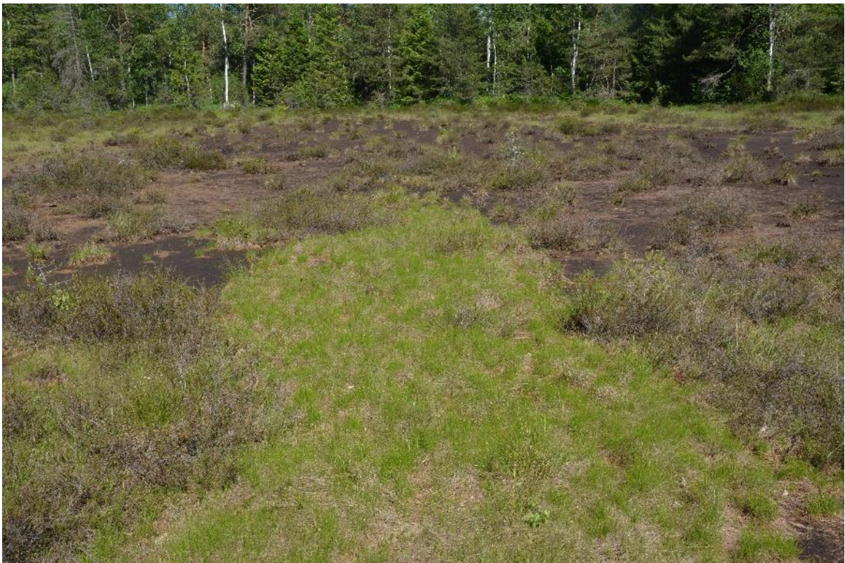
Abb. 12: Teppiche der Weißen Schnabelbinse ( Rhynchospora alba ) (grüne Rasen) im Torfstich des Preisinger Moores

Ihr Erhaltungszustand ist insgesamt als gut zu bewerten, besonders da gravierende Beeinträchtigungen fehlen.