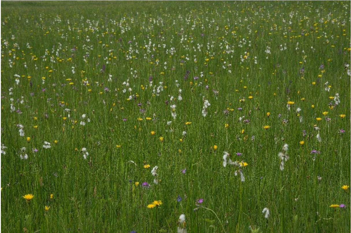
Abb. 14: Kalkreiches Niedermoor (LRT 7230) im Aspekt mit Breitblättrigem Wollgras ( Eriophorum latifolium ) und Mehliger Schlüsselblume ( Primula farinosa ) in der Rothlack

Aufgrund des breiten standörtlichen Spektrums sind unterschiedliche Ausprägungen des Lebensraumtyps zu finden. Nahezu immer bilden sie Komplexe mit den Pfeifengrasstreuwiesen. Besonders charakteristisch sind dabei die Abfolgen der beiden Lebensraumtypen in den Streuwiesen der Rothlack. Am quelligen Oberhang sind hier Davallseggenriede ausgebildet. Mit abnehmendem Kalkgehalt werden sie dann am Unterhang vom Waldbinsensumpf abgelöst.