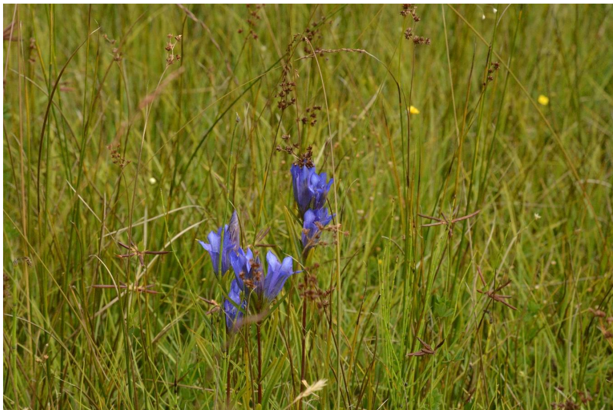
Abb. 6: Lungen-Enzian ( Gentiana pneumonanthe ) mit Spitzblütiger Binse ( Juncus acutiflorus ) in einer Pfeifengraswiese bei Vogling