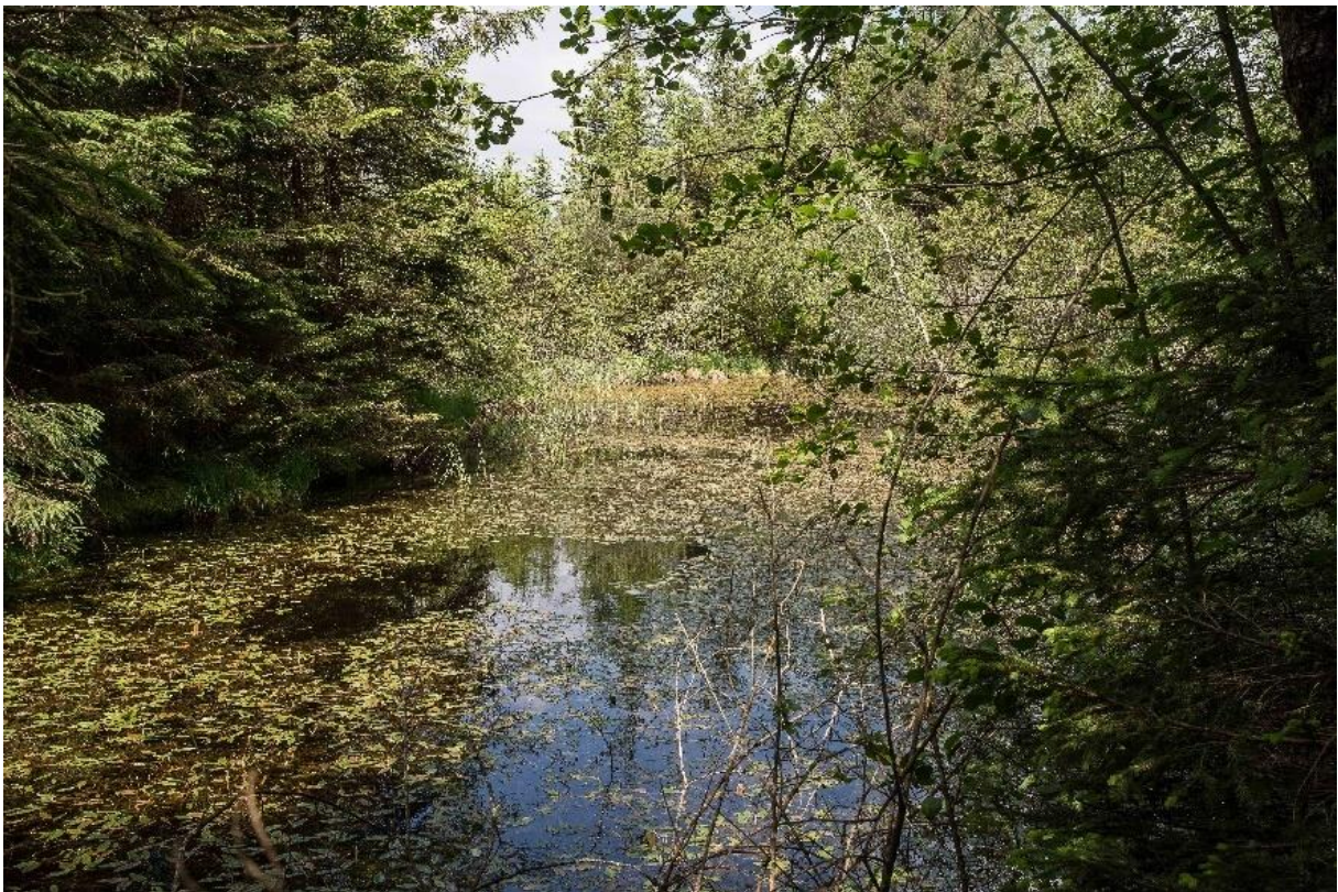
Abb. 21: Eutrophes Stillgewässer mit Decken aus Schwimmendem Laichkraut ( Potamogeton natans ) in einem alten Torfstich im Ochsenmoos

Im Gebiet wurden nur 3 Lebensraumtypflächen (0,10 ha) erfasst. Einmal ist es eine alte Biotopanlage im nördlichen Weitmoos, die beiden anderen Flächen sind frühere Torfstichflächen im Ochsenfilz und in der Pechschnait.