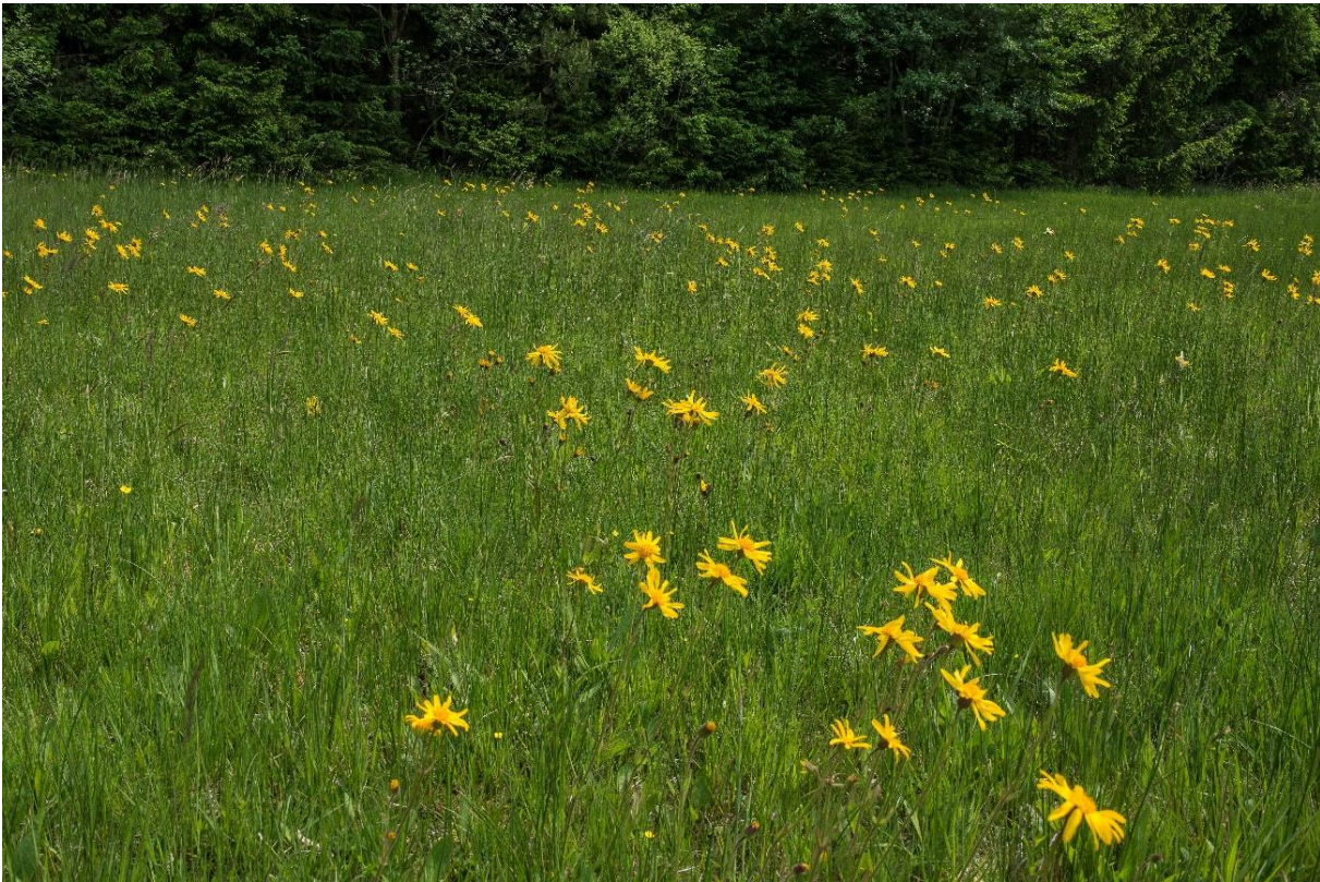
Abb. 4: Artenreicher Borstgrasrasen mit einem dichten Bestand an Berg-Wohlverleih ( Arnica montana ) östlich von Knappenfeld

den Beständen müssen Kennarten der entsprechenden pflanzensoziologischen Einheiten oder auch andere charakterisierende Arten in höherer Zahl vorhanden sein.