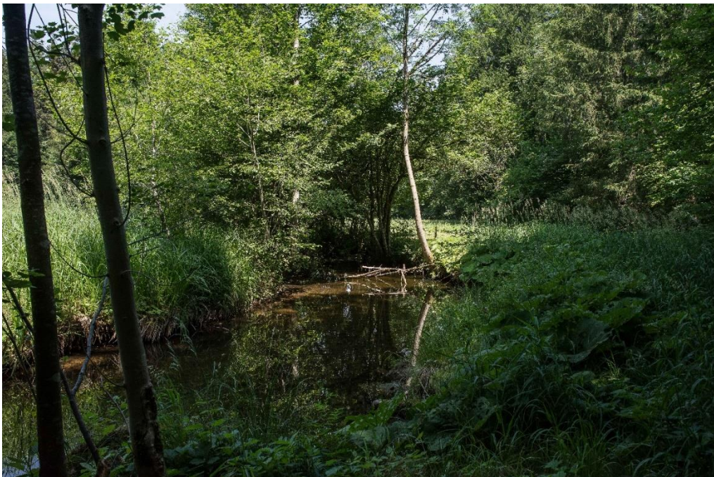
Abb. 8: Pestwurzflur (LRT 6430) mit Rohr-Glanzgras ( Phalaris arundinacea ) am Ufer des Rettenbachs

Im FFH-Gebiet sind solche Lebensraumtypflächen in geringer Zahl (17) und auf nur kleiner Fläche (0,65 ha) ausgebildet. Der Erhaltungszustand kann in allen Fällen als gut (B) bewertet werden.