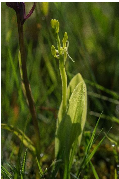
Abb. 37: Sumpf-Glanzkrout ( Liparis loeselii ) in einer Streuwiese im Weitmoos