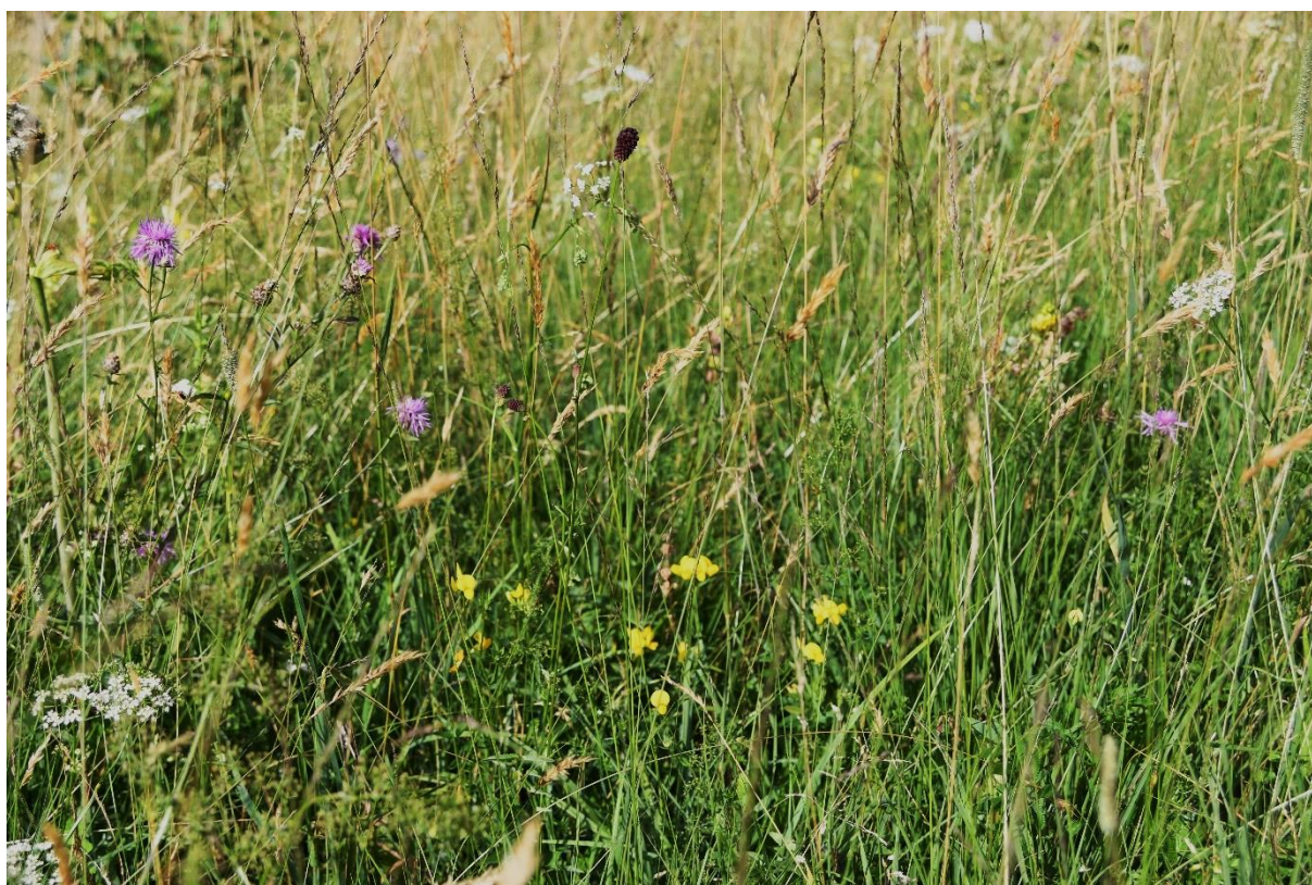
Abb. 22: Artenreiche Flachland-Mähwiese mit Wiesen-Flockenblume ( Centaurea jacea ), Großem Wiesenknopf ( Sanguisorba officinalis ) und Gewöhnlichem Hornklee ( Lotus corniculatus ) am Weitmoos östlich Forst

Die artenreiche 10 oder magere Flachland-Mähwiese (LRT 6510) umfasst dabei die Wiesen, die zum Verband der Glatthaferwiesen (ARRHENATHERION) zählen. Es handelt sich um Wirtschaftswiesen, die eine ganze Reihe von Kriterien erfüllen müssen 11 .