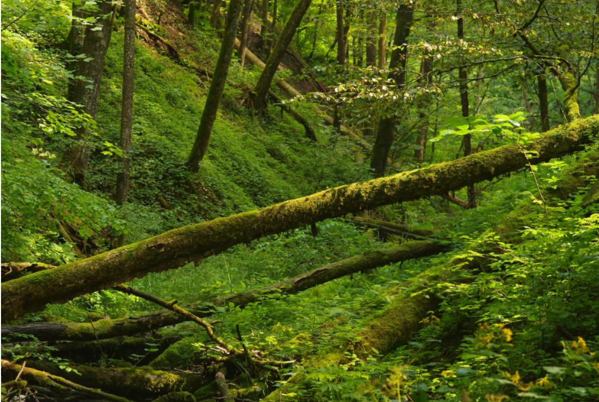
Abb. 26: Naturnaher Giersch-Bergahorn-Eschenmischwald

In diesem Lebensraumtyp werden fünf unterschiedliche Waldgesellschaften zusammengefasst. Im FFH-Gebiet sind die Schluchtwälder überwiegend in der Ausprägung des Subtyps „9184“ Giersch-Bergahorn-Eschenmischwald ( Adoxo moschatellinae-Aceretum pseudoplatani ) auf meist nährstoffreichen Unterhängen vertreten.