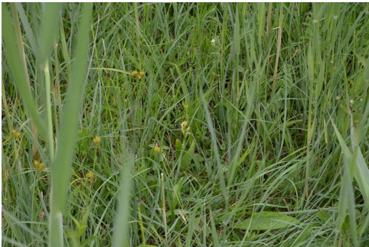
Abb. 38: Detailaufnahme des Bestands. Sumpf-Glanzkraut ( Liparis loeselii) in der Bildmitte. (17.06.2021,)

Der Zustand der beiden Populationen mit minimaler Individuenzahl ist ungünstig, die Habitatstrukturen weisen in einer Fläche noch hohe Bodenfeuchte auf, die andere ist vermutlich aufgrund neuerer Drainagemassnahmen in angrenzenden Flurstücken nur noch mäßig feucht. Streuauflagen, Wuchshöhe der Bestandsvegetation und die Anzahl der offenen Bodenstellen sind nicht optimal, aber noch als gut (B) zu bewerten. Der Gesamterhalt ist für ein Vorkommen noch mit günstig (B) zu bewerten. Das zweite Vorkommen zeigt einen ungünstigen Gesamterhaltungszustand (C), möglicherweise ist es zwischen 2021 und 2022 erloschen. Insgesamt ist die Situation der Anhang II-Art Sumpf-Glanzkraut ( Liparis loeselii ) im Gebiet deshalb als ungünstig (C) zu bewerten.