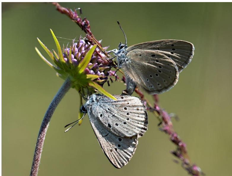
Abb. 32: Heller Wiesenknopf-Ameisenbläuling - Phengaris teleius , Kopula

Entscheidend für den Fortbestand der Art in einem Lebensraum ist eine Nutzung oder Pflege, die auf die regional unterschiedlich ausgebildete Phänologie (Entwicklung des Wiesenknopfs, Auftreten der Falter) sowie die jeweiligen Habitatbedingungen Rücksicht nimmt.