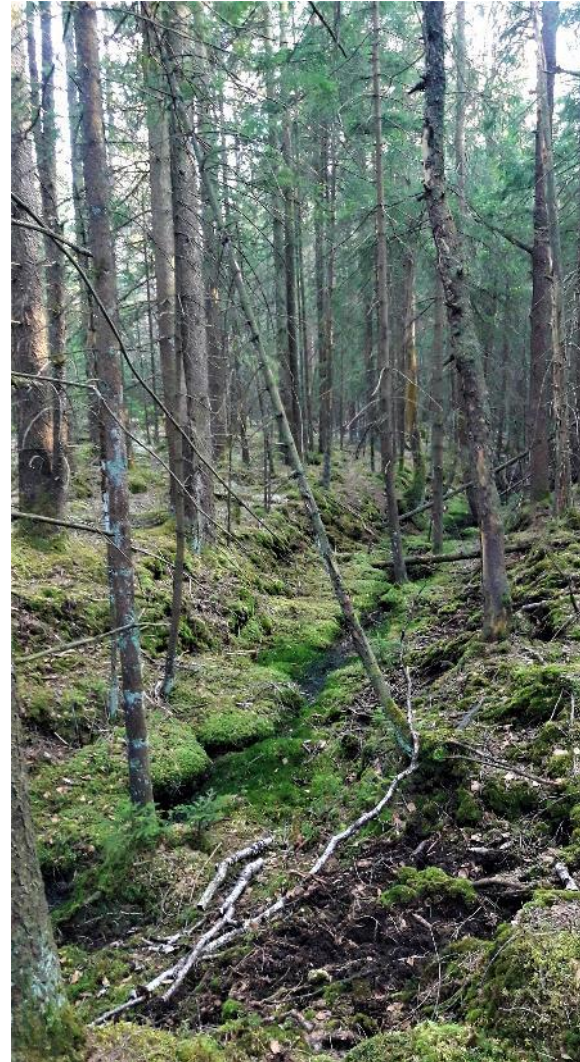
Abb. 45: Alter Graben mit weiterhin entwässernder Wirkung und vererdetem Torfkörper (rechts)