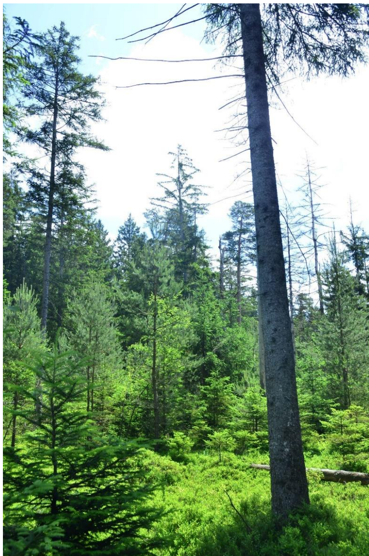
Abb. 20: Fichten-Moorwald im Ödmoos

Der Lebensraumsubtyp ist derzeit in einem guten Erhaltungszustand (B) .