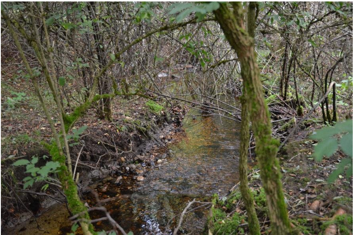
Abb. 3: Naturnaher Oberlauf der Sur mit Vorkommen von Wassermoosen

Der Lebensraumtyp umfasst alle Fließgewässer von den Tieflagen bis ins Bergland, die eine Unterwasser- oder Schwimmblattvegetation mit strömungstoleranten bzw. strömungsresistenten Wasserpflanzen aufweisen.