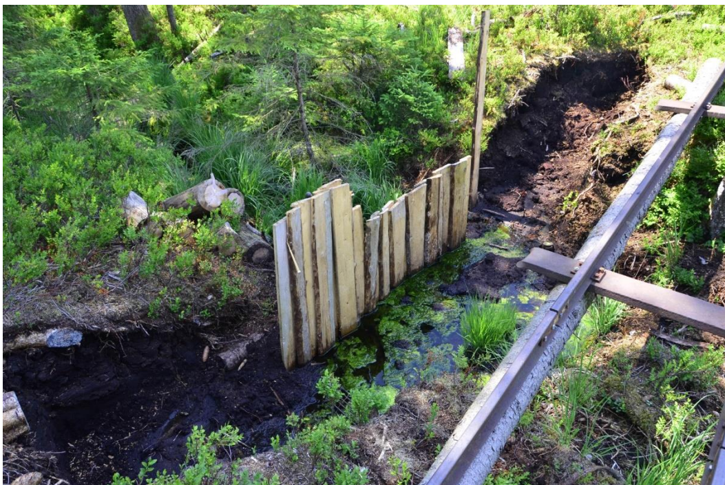
Abb. 46: Beginnende Wiedervernässungsmaßnahmen mit Spundwand im Ochsenmoos (2021)

Hierfür gibt es eine Reihe von Planungen, teilweise sind diese schon in der Umsetzung.