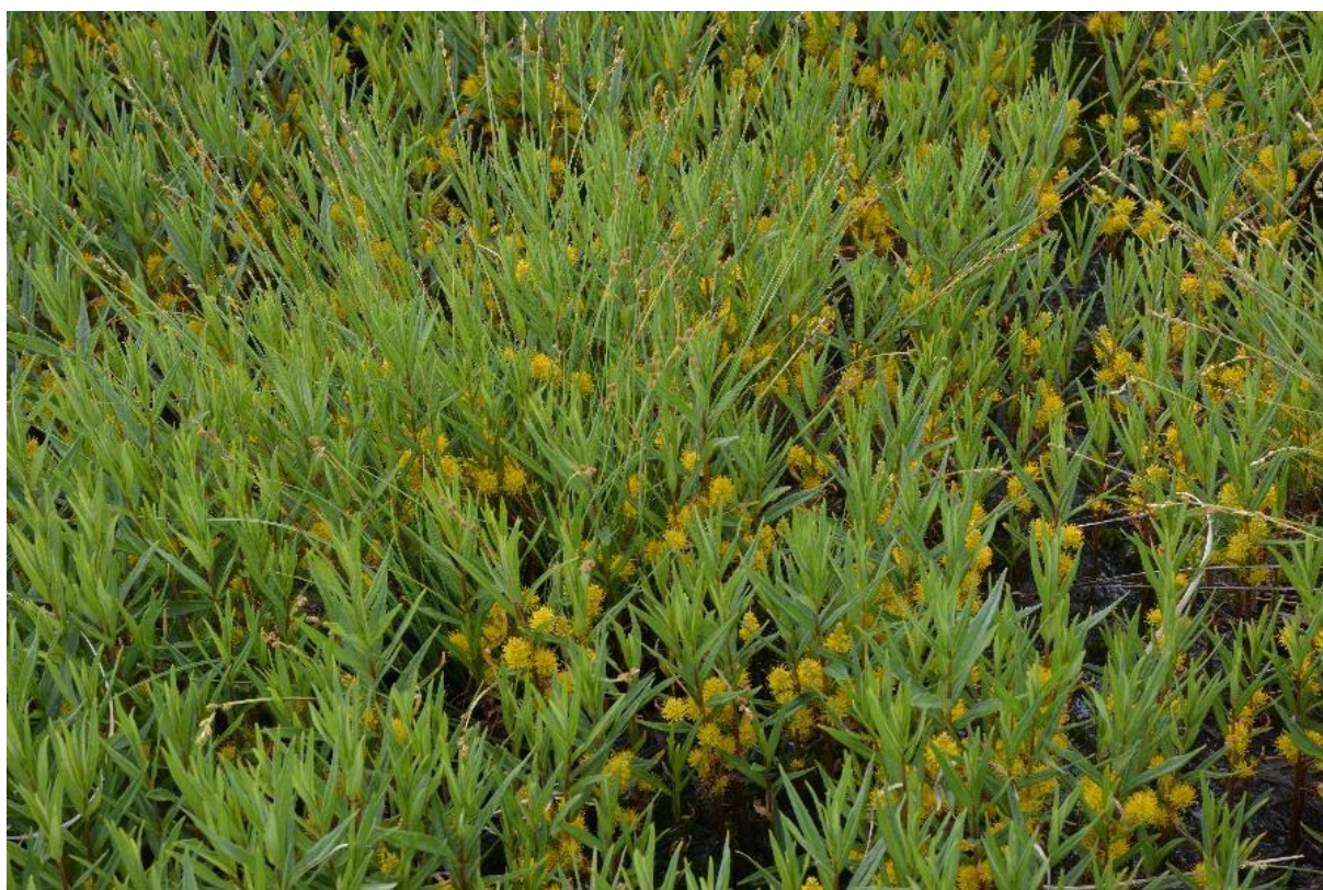
Abb. 11: Massenbestand des Straußblütigen Gilbweiderichs ( Lysimachia thyrsoiflora ) im Übergangsmoor im Ochsenmoos

Eine optimale Pflege von Streuwiesen mit Übergangsmoor-Anteilen ist von vorrangiger naturschutzfachlicher Bedeutung.