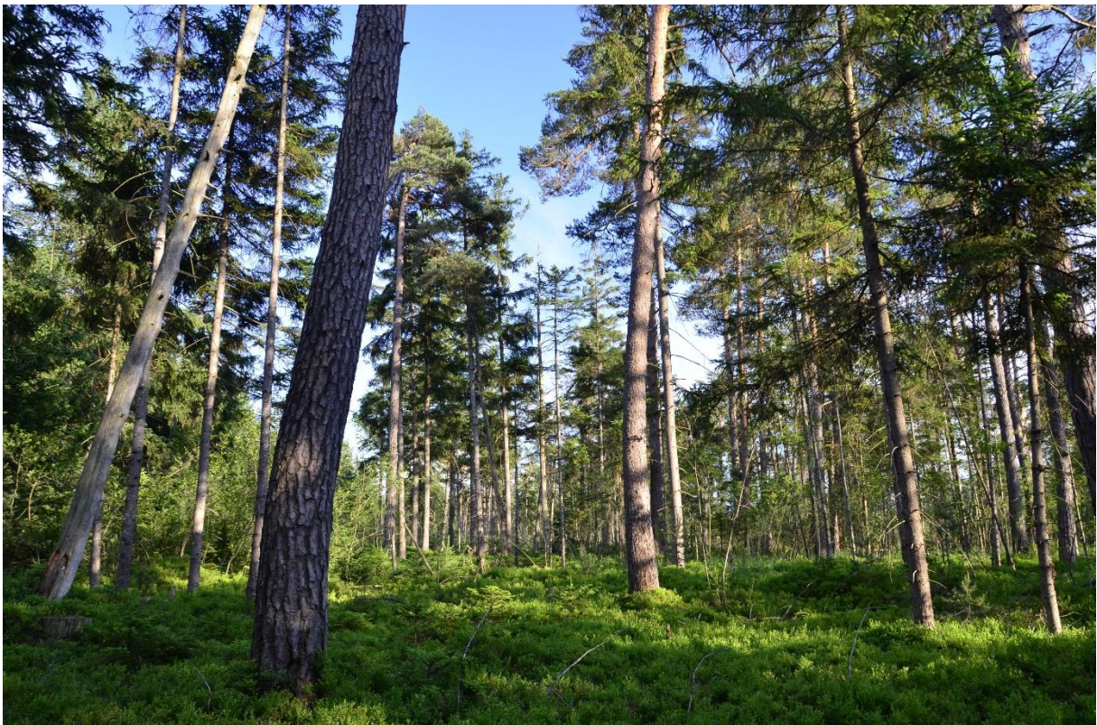
Abb. 16: Waldkiefern-Moorwald im nordöstlichen Teil des Ochsenmoos

Der Subtyp kommt auf nährstoffarmen, sauren Moorstandorten in sommerwarmen und subkontinental getönten Beckenlagen vor. Er wird von der Waldkiefer dominiert. Nebenbaumart ist die Fichte, seltener die Moorbirke. Eberesche und Faulbaum kommen sowohl in der Baum- als auch in der Strauchschicht vor. Die Spirke ist im Alpenvorland örtlich ebenfalls beteiligt, tritt aber im westlichen Alpenvorland häufiger als im Osten auf. Daher ist im vorliegenden FFH-Gebiet v.a. die Latsche anstelle der Spirke anzutreffen. In der Krautschicht sind Arten der Beerstrauch-Gruppe dominant, beigemischt sind oft Arten der Rentierflechten-, Pfeifengras-, Moorbeeren- und der Wollgras-Gruppe.