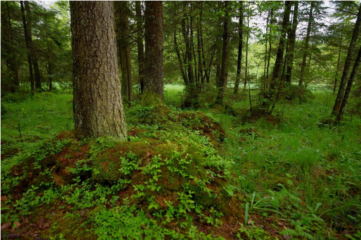
Abb. 30: Fichten-Schwarzerlen-Sumpfwald

Der Schwarzerlen-Fichten-Sumpfwald kommt im Gebiet auf einer Fläche von rund 2,7 ha auf sieben Polygonen vor. Dies entspricht ca. 0,2% der Gesamtgebietsfläche. Die Bestände wurden in den Teilgebieten 04 (Pechschnait), 06 (Weitmoos), 08 (Schönramer Filz) kartiert.