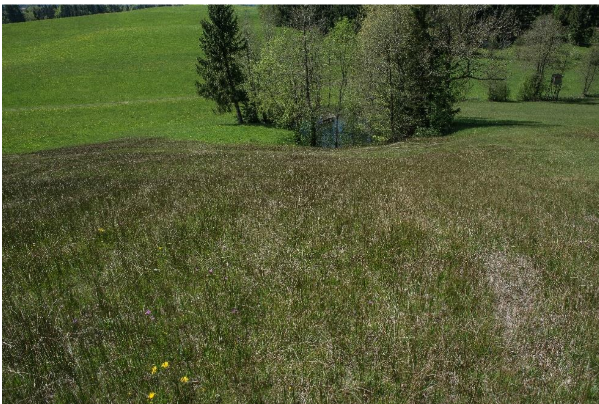
Abb. 24: Kalktuffquelle (LRT 7220*) im ND Surbichl mit Rostrotem Kopfried ( Schoenus ferrugineus ).

Dieser Lebensraumtyp wurde nur an zwei Stellen im Gebiet und auf sehr kleiner Fläche (400 m 2 ) festgestellt.