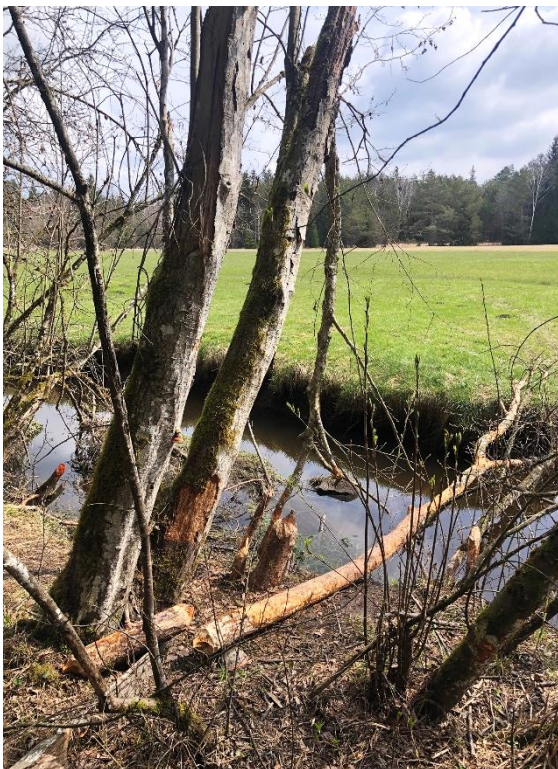
Abb. 42: Nagespuren des Bibers an Grauerle entlang des Auer Bachs