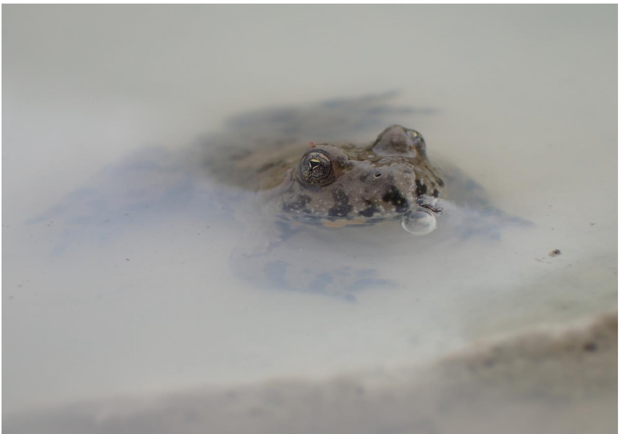
Abb. 36: Gelbbauchunke in einem Laichgewässer

Die Gelbbauchunke ist ursprünglich eine Art natürlicher Fluss- und Bachauen, die dort temporäre Kleingewässer zur Fortpflanzung nutzt. Natürlicherweise vermehrt sie sich auch in flach überstauten Quellsümpfen und in Bereichen mit Hangdruckwasser (GNOTH-AUSTEN & SCHILLING 1991). Da solche Lebensräume stark zurückgegangen sind, nutzt sie auch Sekundärlebensräume wie Fahrspuren, vernässten, vegetationsarme Wiesenmulden, kleinere Wassergräben oder Gewässer in Steinbrüchen und Kiesgruben. Obwohl sie sich prinzipiell auch an flachen Ufern dauernd wasserführender Gewässer vermehren könnte, fällt dort der Nachwuchs häufig Fressfeinden wie Gras- oder Wasserfrosch zum Opfer.