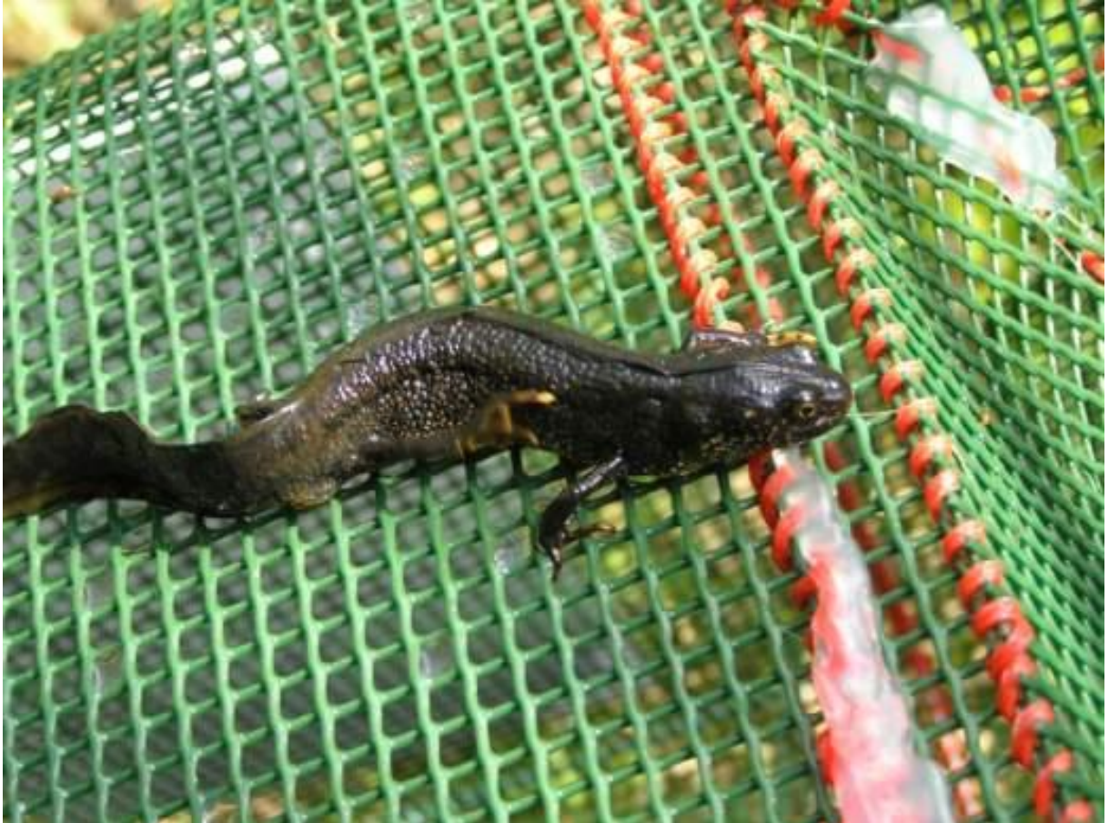
Abb. 35: Kammolch ( Triturus cristatus cristatus )

Die Art bevorzugt im Vergleich zu den anderen heimischen Molcharten relativ tiefe Laichgewässer. Besonders individuenreich kommt er in gewässerreichen Auwäldern, besonders in verkrauteten Altarmen und in Seengebieten vor. Er benötigt zumindest partiell besonnte Gewässer. Günstig sind stärkere Wasserstandsschwankungen mit gelegentlichem Austrocknen, um weitgehende Fischfreiheit zu gewährleisten. Die Überwinterung erfolgt gelegentlich im Wasser, meist aber an Land unter Holz oder Steinen, oft im unmittelbaren Randbereich des Gewässers. Der Kammolch ist relativ ortstreu. Wanderungen wurden bis ca. 1.300 m festgestellt, die meisten Ortswechsel waren jedoch geringer als 400 Meter.