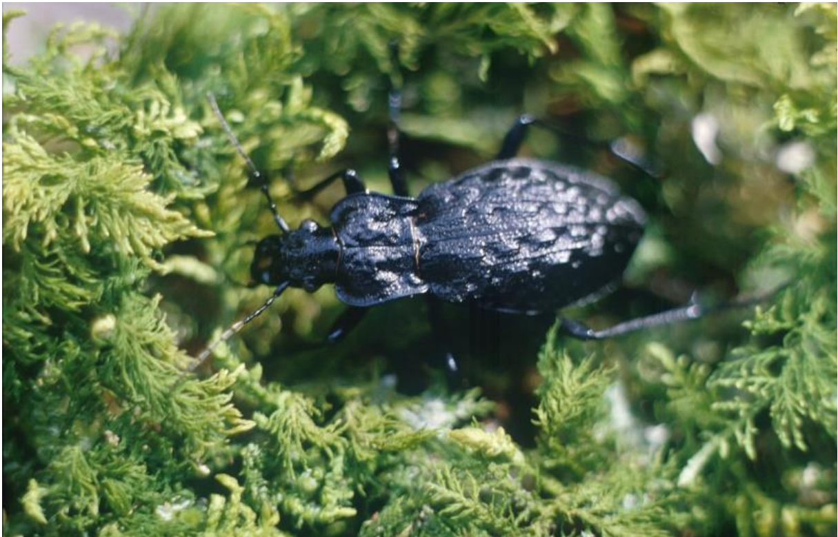
Abb. 40: Gruben-Großlaufkäfer in der moosigen Wiege auf morschem Stock

Es handelt sich um eine streng geschützte Art, die in der aktuellen Roten Liste für Bayern als stark gefährdet eingestuft ist (Rote Liste BY: 2).