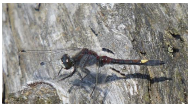
Abb. 41: Große Moosjungfer ( Leucorrhinia pectoralis )

Gefährdungen und Beeinträchtigungen sind: Veränderungen des Wasserhaushalts, insbesondere Absenken des Wasserspiegels, Beeinträchtigung und Verlust der submersen Vegetation durch Nährstoffeinträge, die Verfüllung von Kleingewässern, die zunehmende Verlandung der Larvalgewässer und Beschattung durch Gehölzsukzession im Umfeld sowie Fischbesatz.