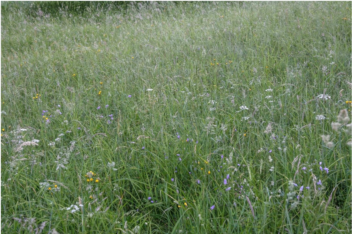
Abb. 23: Berg-Mähwiese mit Weichhaariger Pippau ( Crepis mollis ) und Wiesen-Glockenblume ( Campanula patula ) am Lengwiesbach bei Oberreut

Berg-Mähwiesen (6520) sind ebenfalls nur extensiv bewirtschaftete Wiesen, die von der submontanen bis subalpinen Stufe wachsen. Sie zählen zum Verband der Gebirgs-Goldhaferwiesen (POLYGONO-TRITSETION). Auch sie sind besonders blütenreich und weisen einen hohen Anteil an Magerkeitszeigern auf.