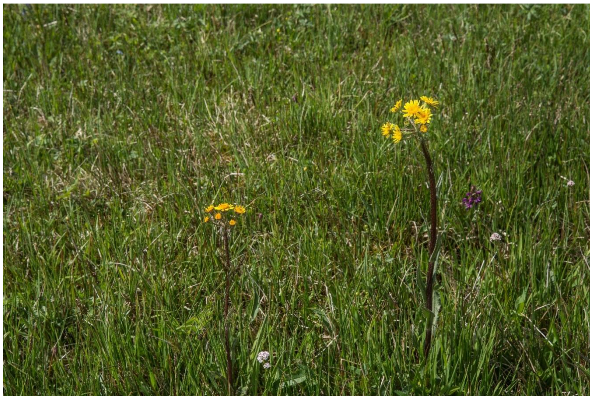
Abb. 7: Spatelblättriges Greiskraut ( Tephrosia helenitis ) in einer Pfeifengraswiese auf dem Pechschnaitfeld bei Abstreit