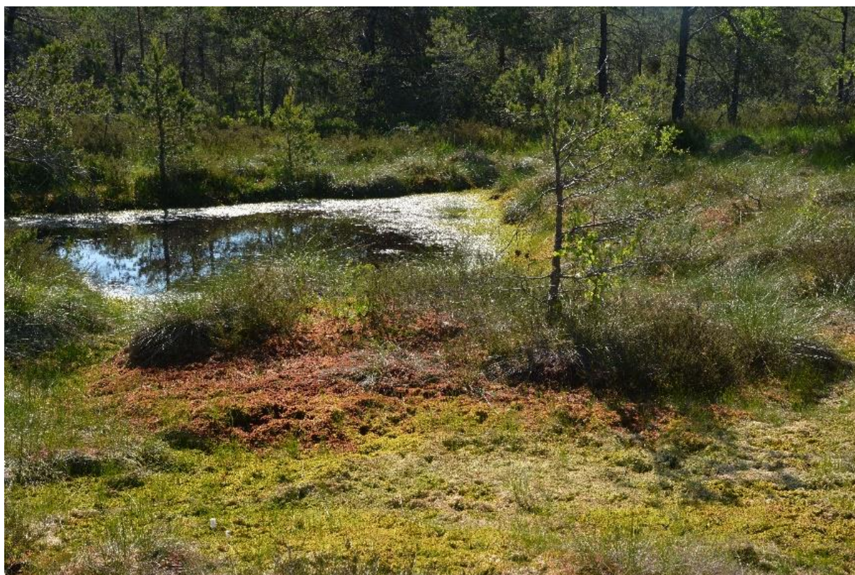
Abb. 2: Sehr naturnah anmutendes dystrophes Stillgewässer im Stöckelmoos mit Schwingdecken aus Torfmoosen und Großseggensäumen

Der Lebensraumtyp umfasst die natürlichen oder naturnahen Stillgewässer, die durch Huminsäuren orange bis braun gefärbt sind und die einen niederen (sauren) pH-Wert aufweisen. Die Seen und Teiche liegen direkt im anstehenden Torf oder stehen in engem Kontakt zu Torfsubstraten. Im Gebiet fehlen in Folge des Torfabbaus natürliche Moorgewässer wie Moorkolke. Dystrophe Stillgewässer sind hier Torfabbauflächen, die inzwischen mit Wasser gefüllt sind. Insgesamt wurden 21 dystrophe Stillgewässer mit einer Gesamtfläche von 17,95 ha erfasst. Die Größe reicht von Seen mit über 6 ha Wasserfläche, wie der Heidesee im Schönramer Filz, bis hin zu kleinen Moortümpeln mit weniger als 100 m 2 Wasserfläche, beispielsweise im Stöckelmoos.