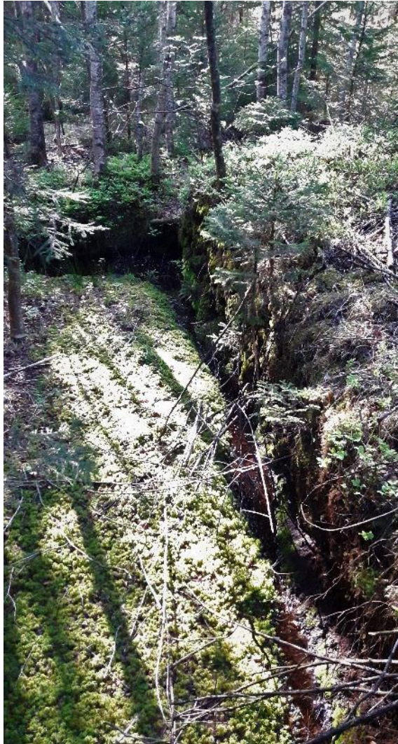
Abb. 44: Gut sichtbare Torfstichkante mit Torfmossneubildung an der Grabensohle

Dies stellt eine deutliche Beeinträchtigung der Moor-Lebensraumtypen dar. Die Herstellung des naturnahen Wasserhaushalts durch die Verbauung der Entwässerungseinrichtungen mit dem Ziel wieder einsetzender Torfbildung, zumindest aber dem Erhalt bzw. der Reaktivierung der Lebensräume moortypischer Arten sind deshalb von hoher Priorität.