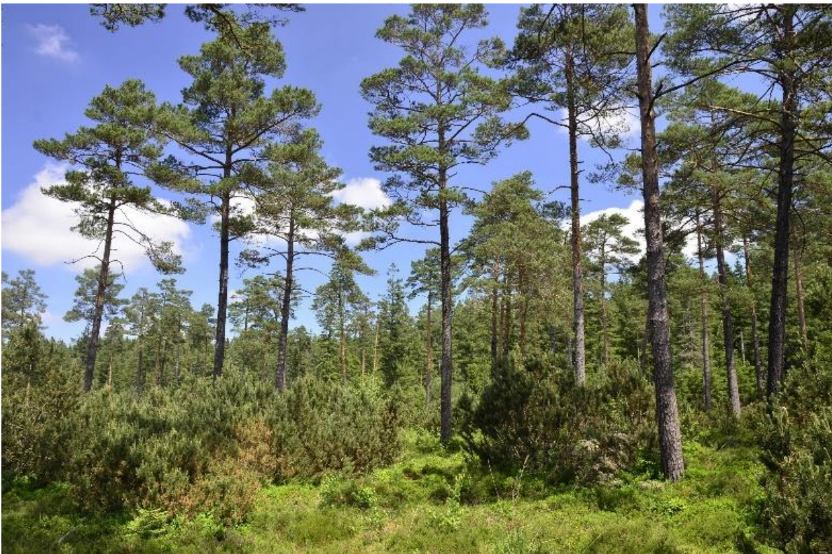
Abb. 17: Latschen-Moorwald unter lichter Waldkiefer im Ödmoos